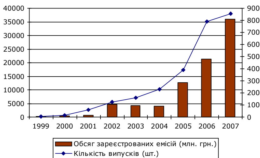
Рис.1 Динаміка випуску облігацій в Україні за 1999-2007 роки